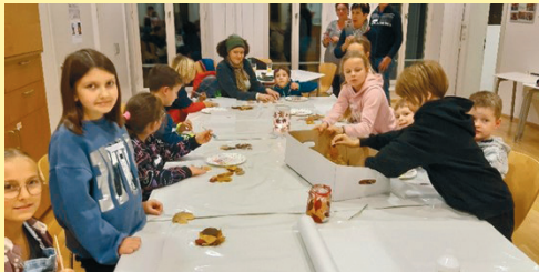
Gemeinsames Basteln von Martini-Laternen mit anschließendem Spaziergang durch die Stadt