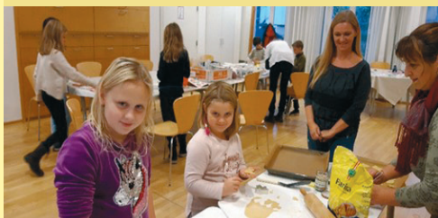
Backen und basteln für Weihnachten